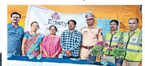
కార్యక్రమంలో పాల్గొన్న ప్రతినిధులు