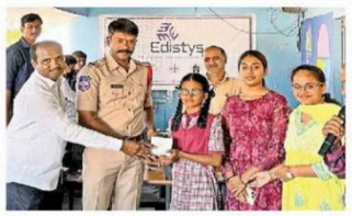
విద్యార్థులకి బహుమతిని అందజేస్తున్న ఎస్ఐ